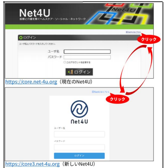
ログイン画面で切り替えができます。

7月26日（月）より、新しいNet4Uが利用可能となります。現在、Net4U内でも新Net4Uのデモサイトが公開されていますが、基本的な登録内容はおおきく変わらず、操作画面のレイアウトが主に変更となります。リニューアルに伴い、7月22日（木）7時～26日（月）9時までシステム移行作業のためNet4Uを利用いただくことができません。7月26日（月）9時以降から新Net4Uを利用することが可能となりますが、しばらくの間は現在お使いいただいているNet4Uを今まで通り使っていただくことも可能です。ログイン画面で新Net4Uと現在のNet4Uを切り替えることができ、どちらのNet4Uで操作しても、同じデータベースに登録・参照となります。ご不明点等は地域医療連携室ほたるまでお問い合わせください。